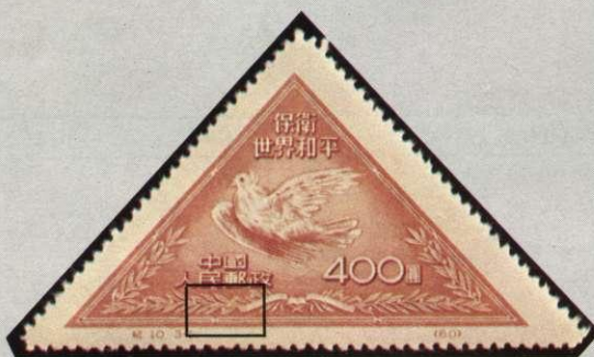
N° 904 et 906