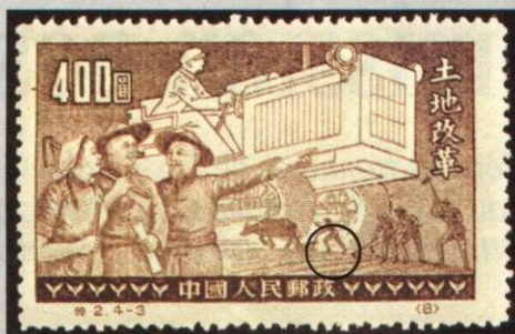
N° 929 A/D

réimpression: deux traits (cote de la série: 4 F).