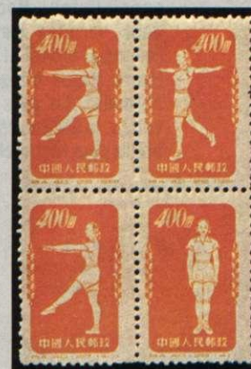
N° 933/942 C